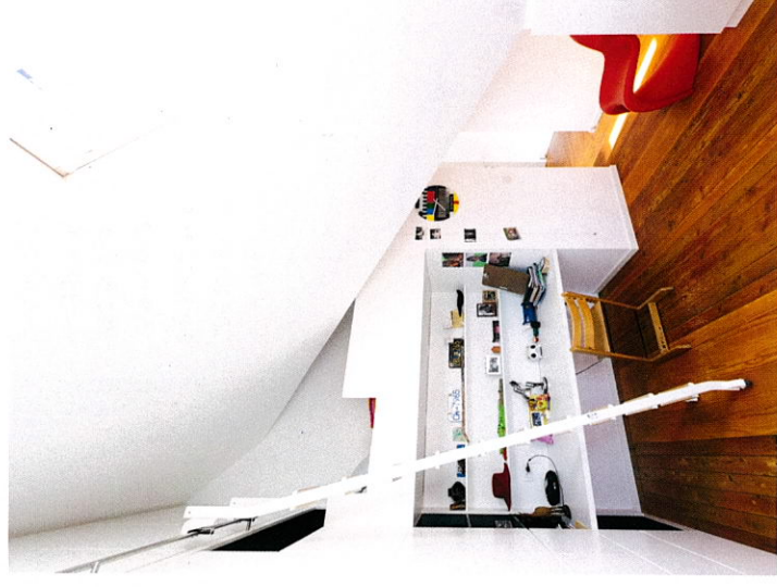
Ikgabouwen & Renoveren

CH-Architecten boog zich over die uitdagende zolder en leverde een plan met twee kamers, toegankelijk via een inkomssas met dressing en een aparte badkamer. Er werden kleine ruwbouwwerken uitgevoerd. Zo werden de raamopeningen in de voor- en achtergevel verplaatst, zodat er plaats vrijkwam om een lange kastenwand te plaatsen tegen de gemeenschappelijke (hoogste) gevel. Gezien het dak al geïsoleerd was, moesten ▶