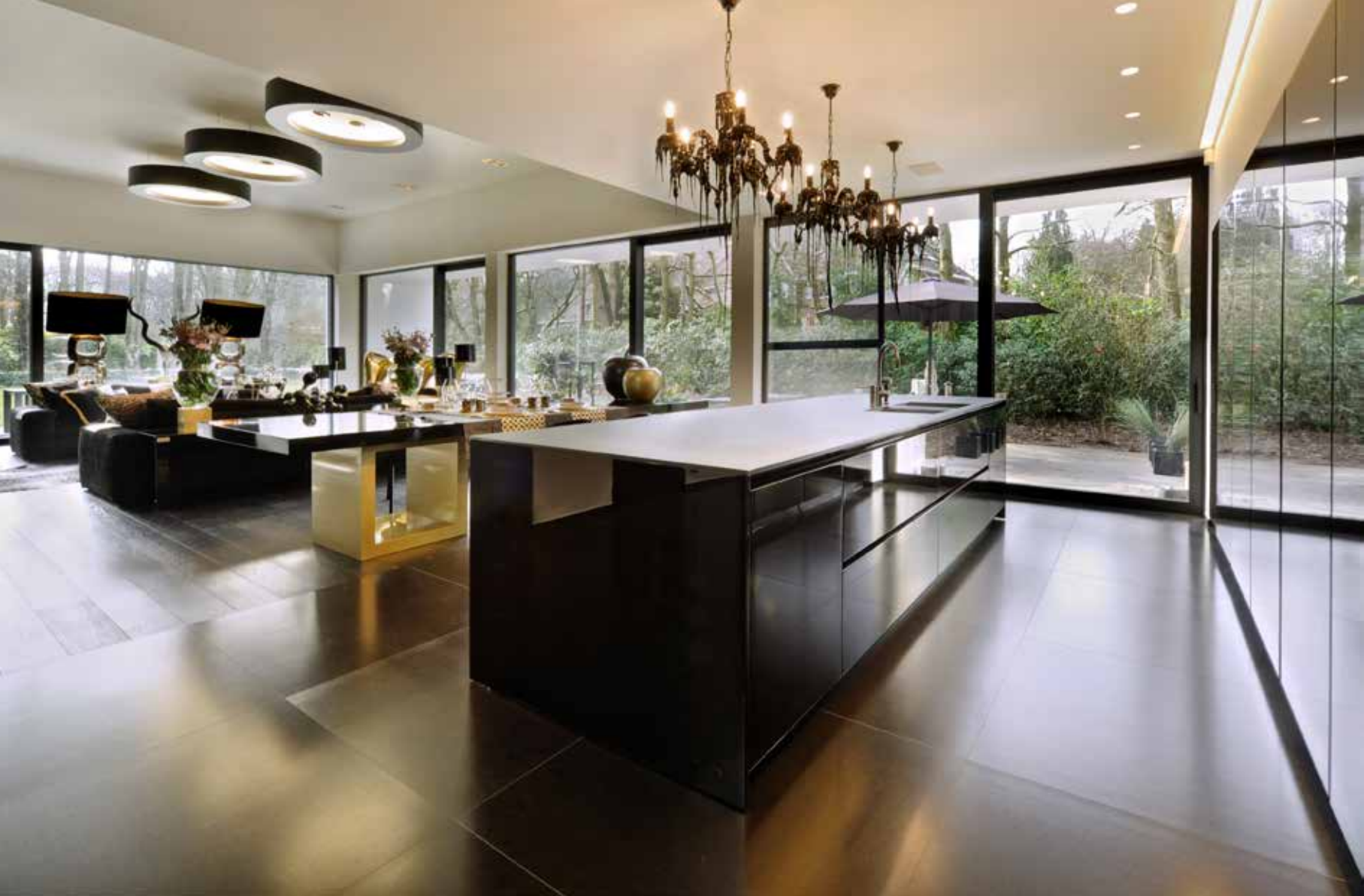
Veel daglicht in de keuken door grote raampartijen.