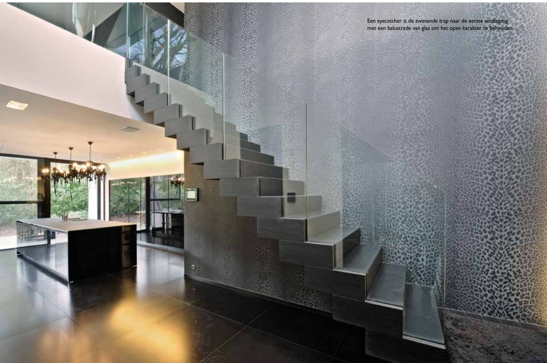
Een eyecatcher is de zwevende trap naar de eerste verdieping met een balustrade van glas om het open karakter te behouden.