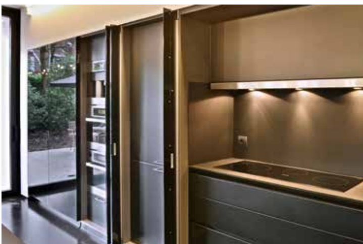
Het maatwerk meubilair werd verzorgd door Kast-ID.