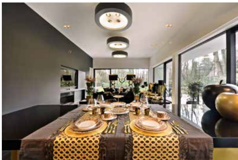
Het servies van het merk Roberto Cavalli.

Regelmatig waren Nathalie en Zara op de werf te vinden, in de weer met stalen en stoffen. Nathalie: "We wilden zien hoe de kleuren uit zouden komen in het licht ter plaatse. We wisten dat het parket en de muren zwart zouden worden en we wilden contrasten hebben die mooi bij de woning zouden passen."