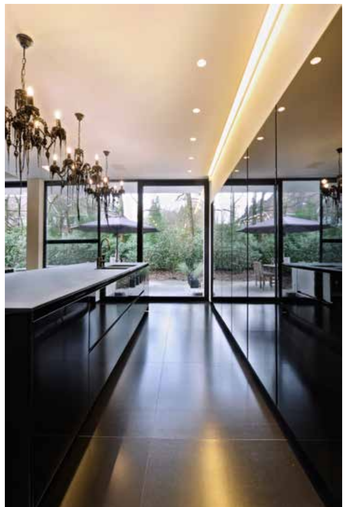
Het grote kookeiland scheidt de keuken van de living. Alle apparatuur inclusief het fornuis zijn weggewerkt achter gesloten kastdeuren.