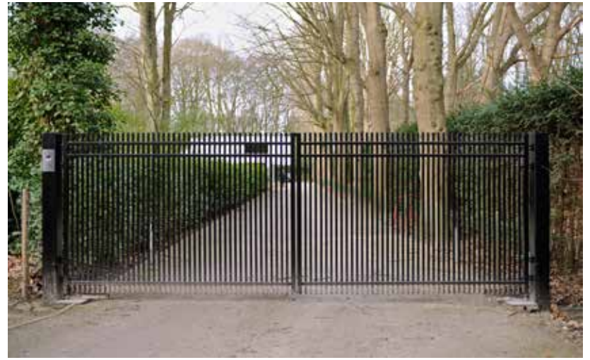
De villa met oprit is afgesloten middels een op maat gemaakte poort van AEC poorten.

"Soms denken mensen dat de oprit een weggetje is dat niet aangeduid is"