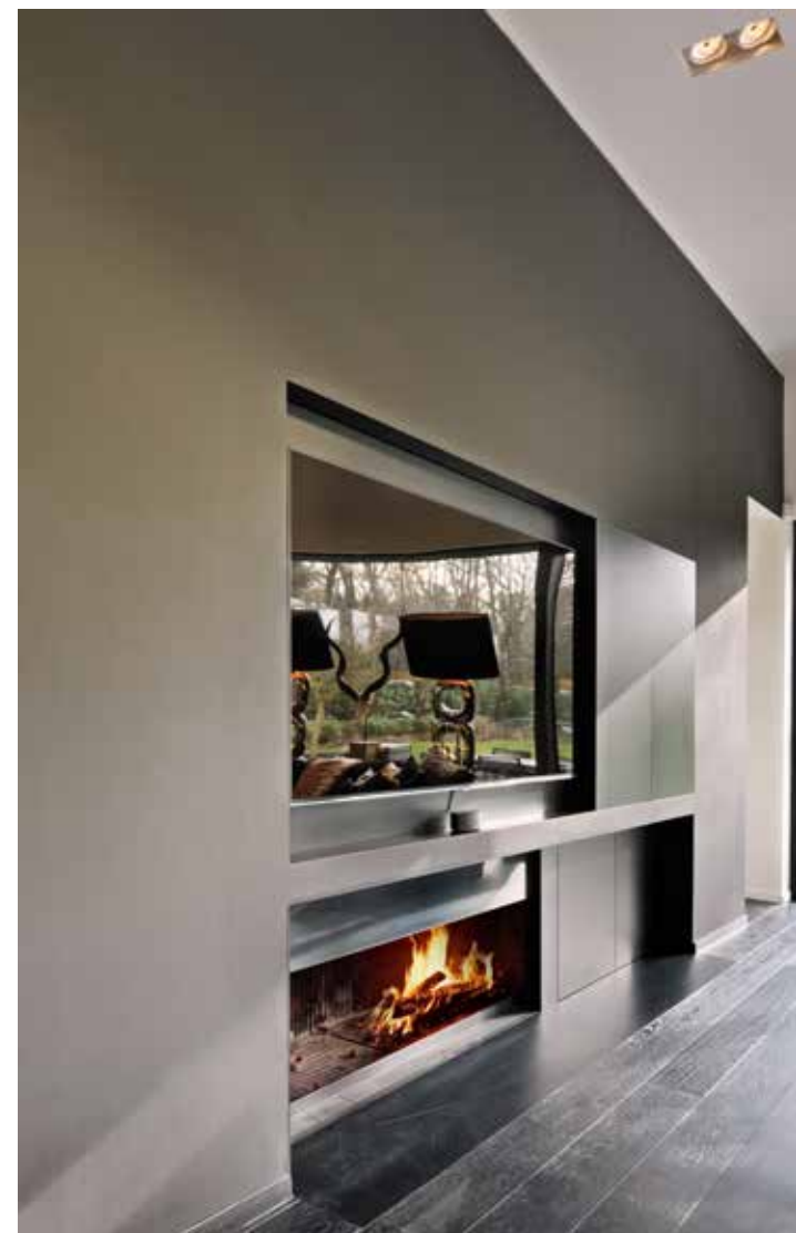
Onder het TV-scherm van B&O een brede gashaard van de Puydt Haarden.